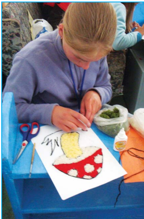
На слете «Елабуга-2009»

Первые две недели юные краеведы увлеченно занимались подготовкой к слету: слушали лекции по краеведению, природоведению, истории края, учились выступать на конференции, определять виды растений, различать голоса птиц, проводить экскурсии, ориентироваться на местности, составлять топографические карты, преодолевать препятствия с помощью веревок и подручных средств и многому другому.