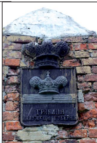
Пограничный столб на трассе Козельск-Белев