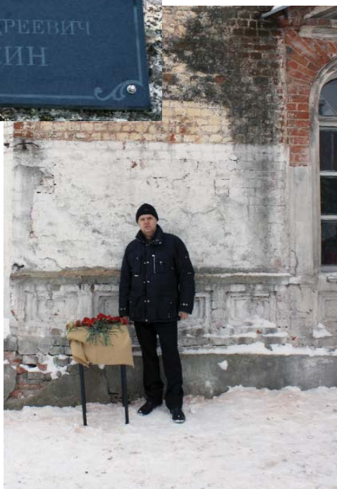
Открытие мемориальной доски П.А. Кикину. Большая Аleshня. 26.02.2009