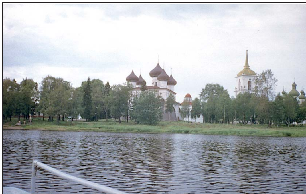
Каргополь. Вид с реки Онеги

Каргополь — старейший из северных городов Древней Руси, годом его основания считается 1146 — таким образом, Каргополь на один год старше Москвы. В его истории есть еще немало загадок. Загадка таится и в самом названии города. Не одно поколение исследователей пыталось выяснить его происхождение. Каких только предположений не выдвигалось! В одном из вариантов Каргополь — «каркун-пуоли» — переводили с финского языка как «медвежья сторона», в смысле «медвежий угол», захолустье.