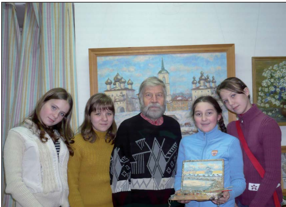
Встреча с местным художником в центре народных ремесел «Берегиня»

За Каргополем с XVI века закрепилось название «Каргополь белокаменный». Построенный во времена Ивана Грозного белокаменный собор Рождества Христова красуется до сих пор на Соборной площади — историческом центре города.