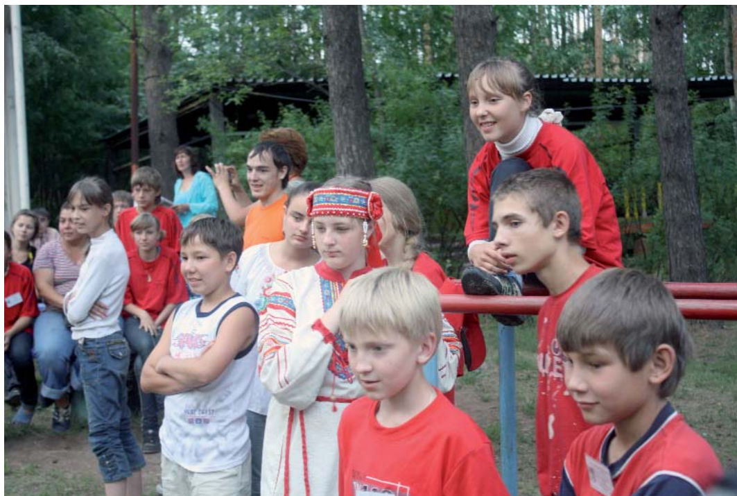
Зрители конкурса «Народная игра»

Для ребят провели экскурсии по городу. Они побывали на древнем Елабужском чертовом городище, полюбовались необъятной ширью долины реки Камы и впадающей в нее реки Тоймы, поняли, что это, действительно, самое защищенное от непрошенных гостей место для поселения, прикоснулись к древней стене и задумали главное пожелание (по поверью, оно обязательно должно исполниться).