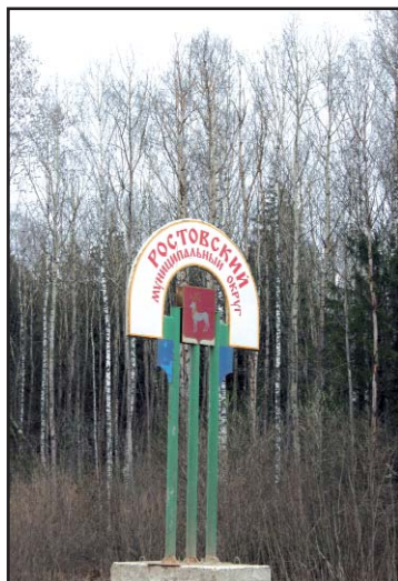
Ориентир, где стоял пограничный столб в дер. Кулаково

Конечно, такая находка усилила мой интерес к истории пограничных столбов. И снова я пришел в библиотеку, показывал фотографии из вашего журнала и свои собственные, но никто не мог мне дать ответа. Прошло лето, а мои поиски не увенча-