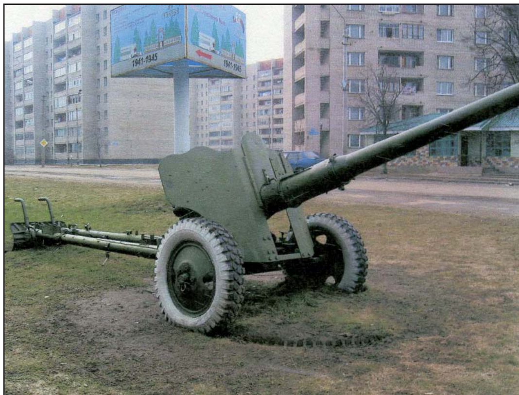
Ходовая часть и щитовое прикрытие пушки Д-44

сооружении и живой силы противника, уничтожения бронированной техники и долговременных огневых точек.