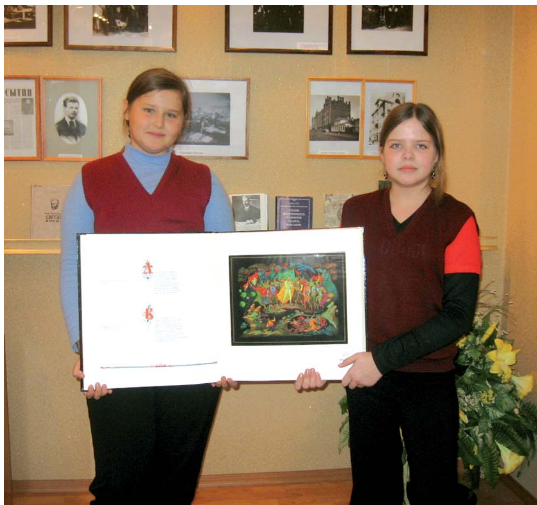
А это — самая большая книга музея.

Музей истории книги еще совсем молодой. Он открылся 29 января 2008 года, но уже стал известен в районе и городе, его посетили более 400 человек. В книге отзывов остались такие записи: