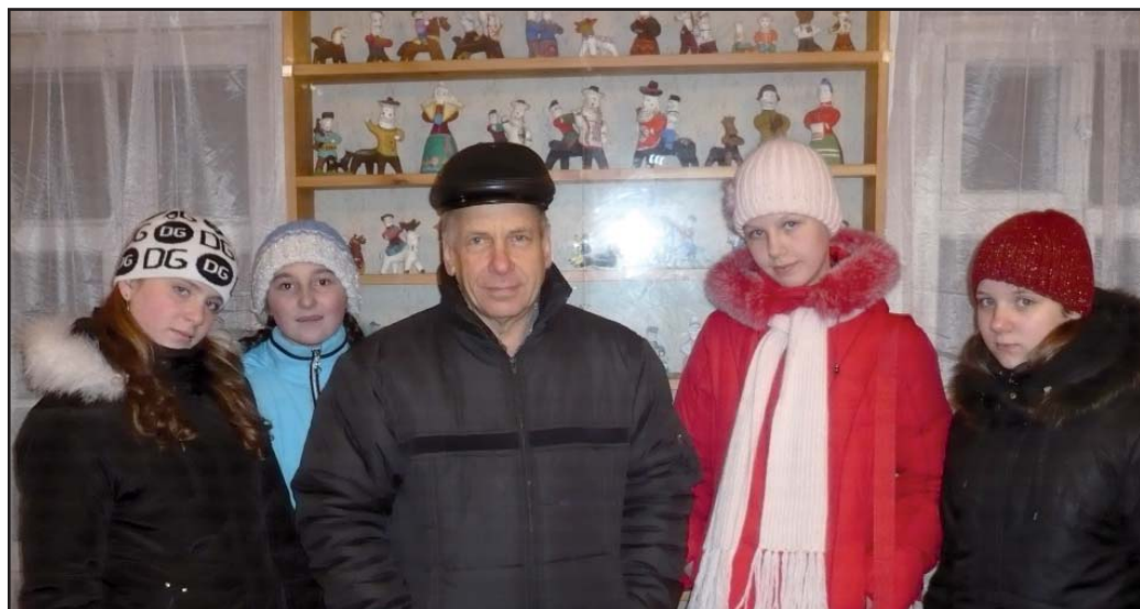
В гостях у глиняных дел мастера

Отведет всегда напасти Птица северного счастья. И несет удачу щедро Пусть на все четыре ветра.