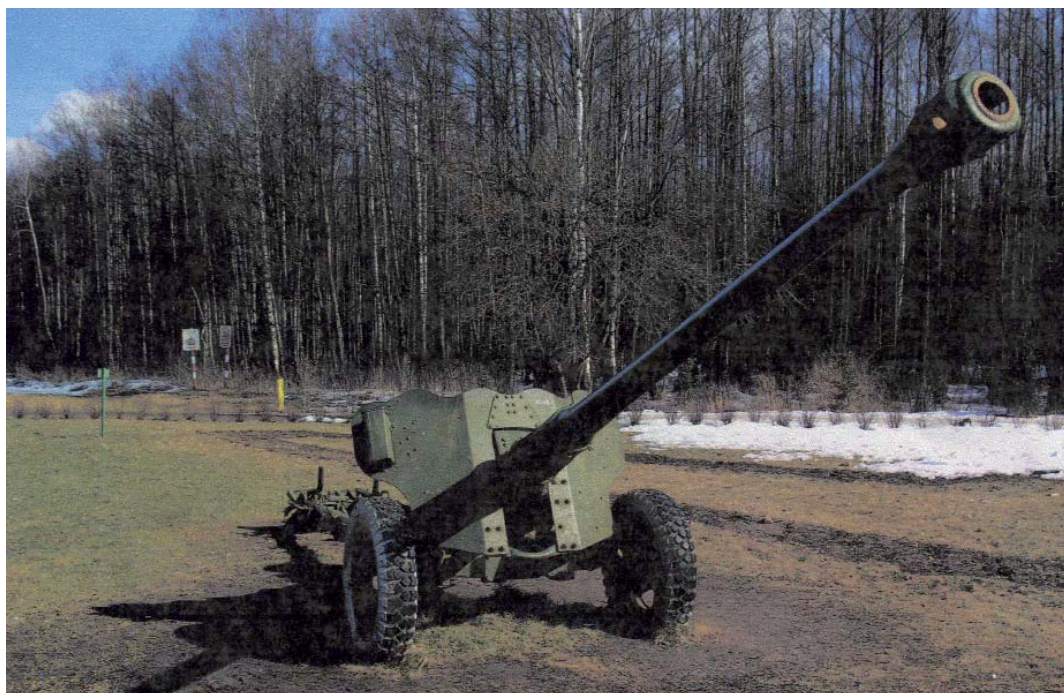
Пушка Д-44

Но я считаю, что о памятниках-пушках надо знать больше, поскольку на пушках нет ни табличек, ни памятных надписей. Сбор материала о пушках я начал с определения их названия, изучения истории создания, устройства и технических характеристик.