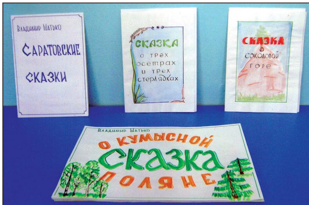
Творческие работы детей

ти, после чего им захотелось создать свою Красную книгу. Получилось очень интересно.