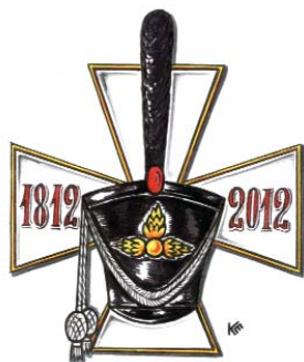
Эмблема к 200-летию Бородинского сражения Художник Е. Комаровский