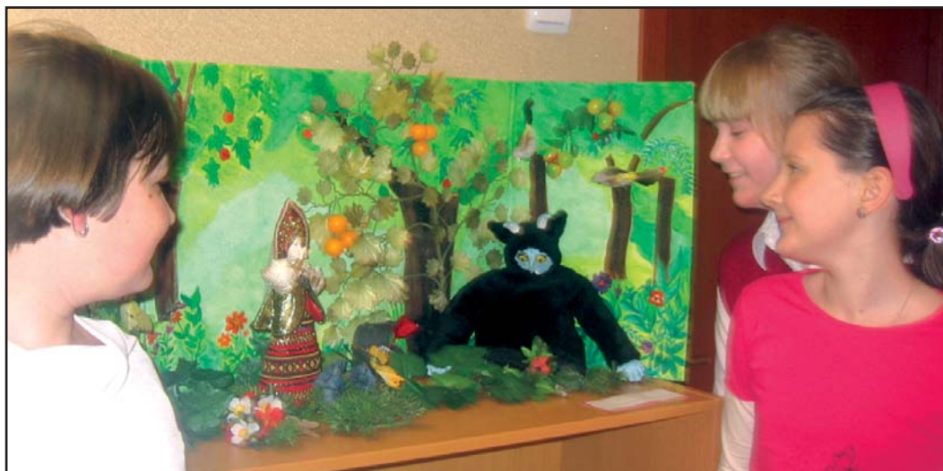
Музей школы. У макета «Аленький цветочек».