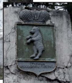
Дер. Кулаково Ярославской области