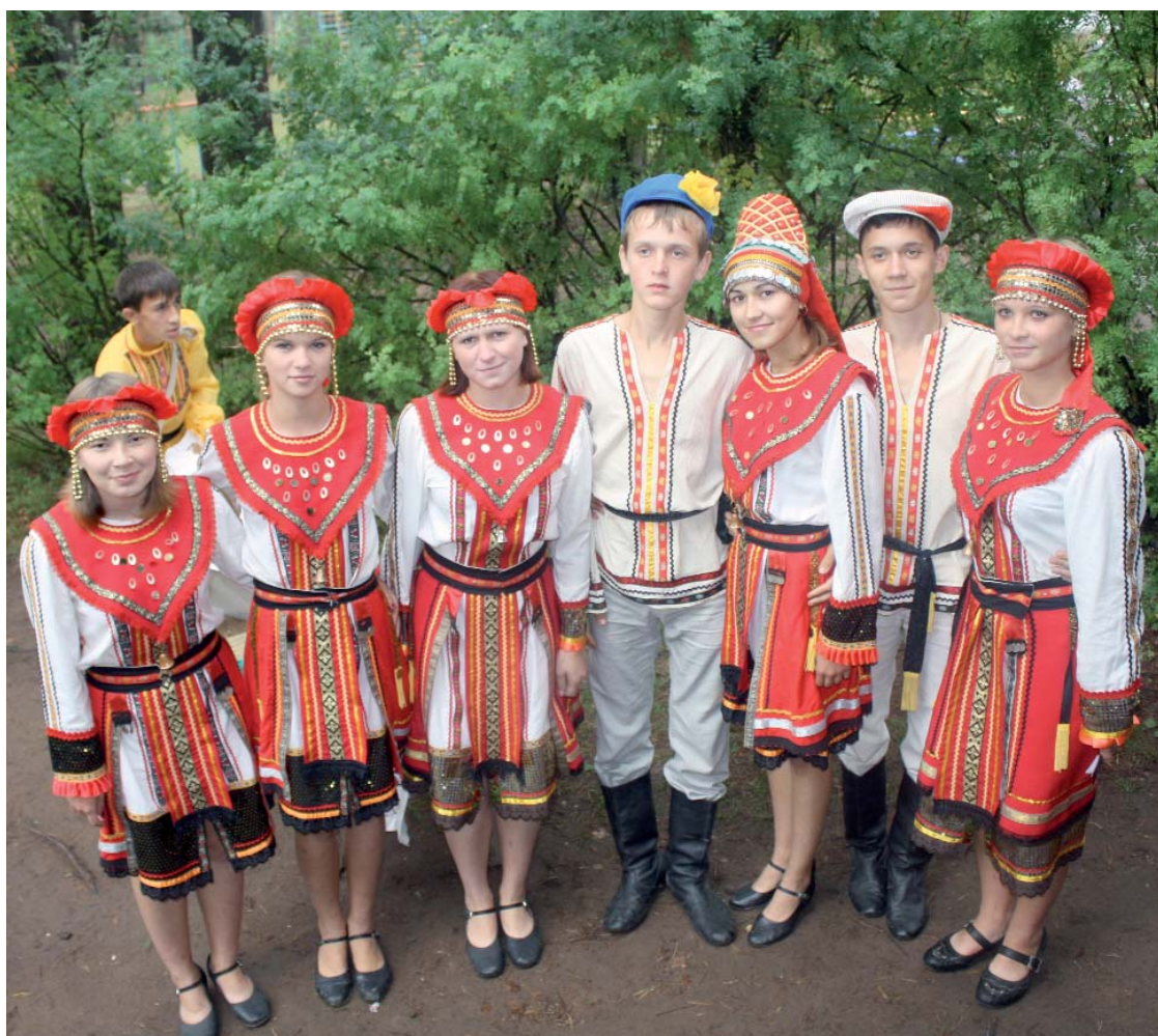
Мы говорим — спасибо, Елабуга!

По туристско-экологическому направлению второй год подряд очень хорошо выступала команда из города Пензы, заняв первое место в общекомандном зачете. Успешно выступили команды юных туристов-экологов из Республики Марий Эл и команда из города Нижнего Тагила Свердловской области, занявшие второе и третье места соответственно. Команде города Белорецка Республики Башкирии удалось завое-