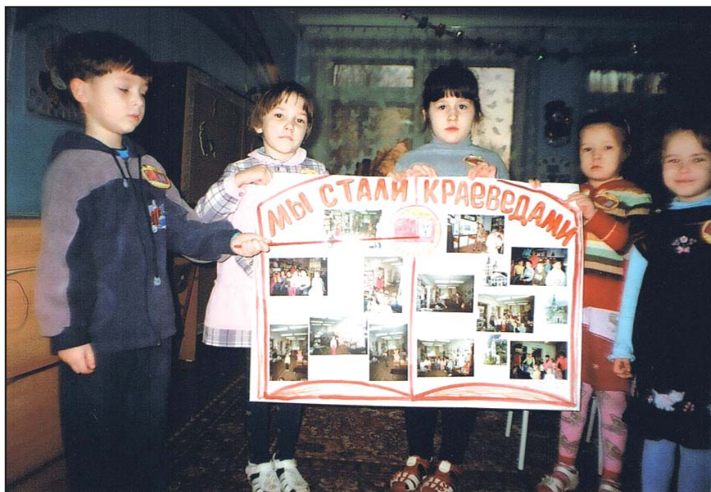
Воспитанники детского сада № 223

за, клуб «Юный краевед» имеет свой герб-эмблему и гимн.