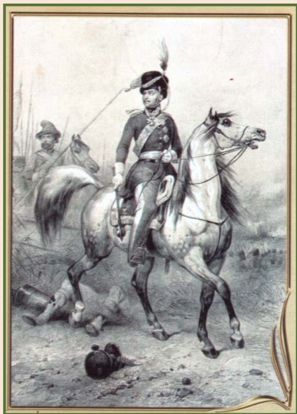
Конный портрет М. И. Платова. Литография. Неизвестный худож. II пол. XIX в.

М.И Платов был на военной службе с 13 лет, участвовал в русско-турецких войнах, штурмовал Измаил.