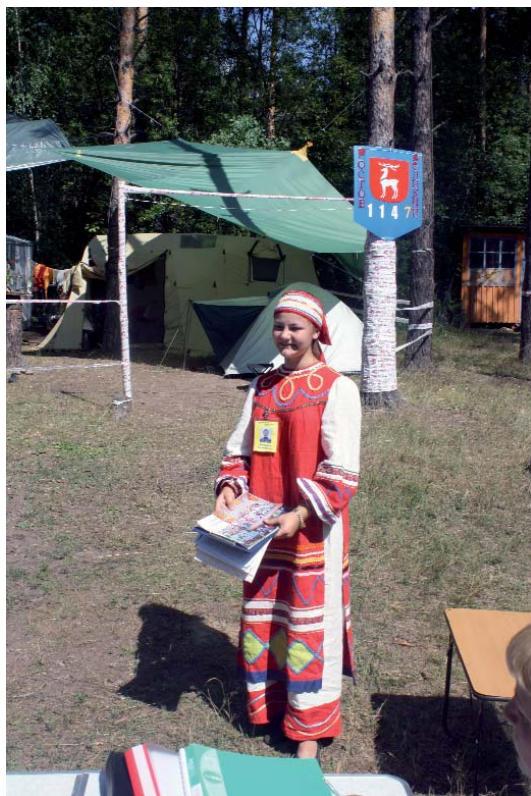
Защита конкурсной работы

А какая музыка звучит в самих названиях экскурсий! «Елабуга в фасадах купеческих домов» (Ростов Великий, Ярославская область), «Живая история» (Республика Марий Эл), «Зеркало истории города Елабуги» (Дубна, Московская область), «Сердце Елабуги — деятельность купцов Стахеевых» (с. Хворостянка, Самарская область), «Исторический центр уездной Елабуги» (Дуванский район, Республика Башкирия), «Православный уголок Елабуги» (Мытищи, Московская область), «Елабуга двадцатого века» (Пенза), «Обзорная экскурсия по улице Казанской» (Костромская область), «Волшебный ажур на улицах Елабуги» (с. Мокеевское, Ярославская об-