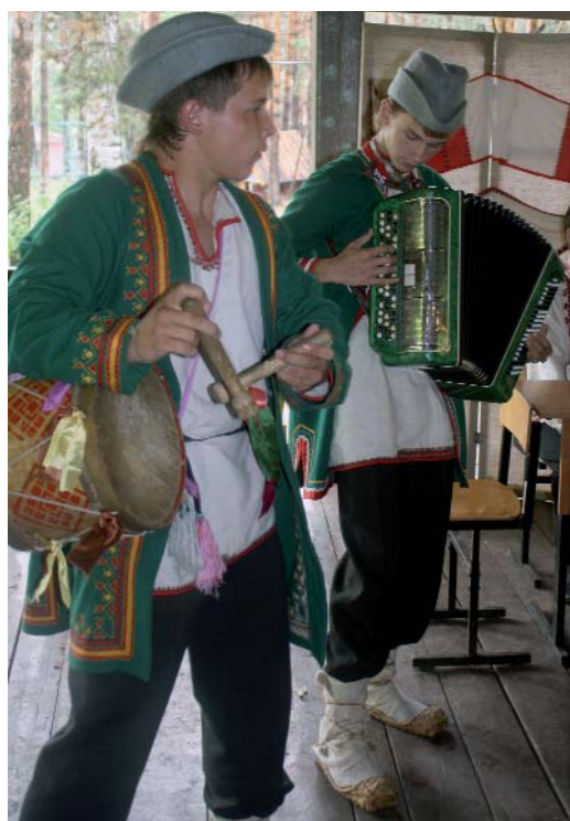
Конкурс «Обычай и обряды моего народа»