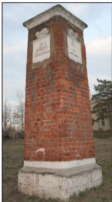
Пограничный столб. Пос. Щурово Московской области