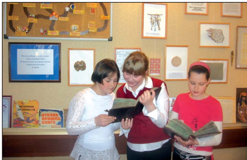
Музей школы. С волнением рассматриваем старинные книги. Они особенно ценны тем, что в них есть точная дата издания — 1797 год, Москва.