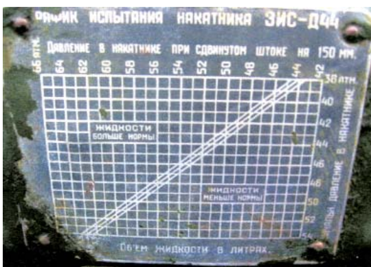
Таблица «График испытания накатника ЗИС-Д44»