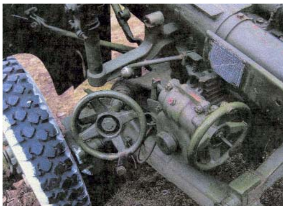
Поворотные механизмы пушки Д-44