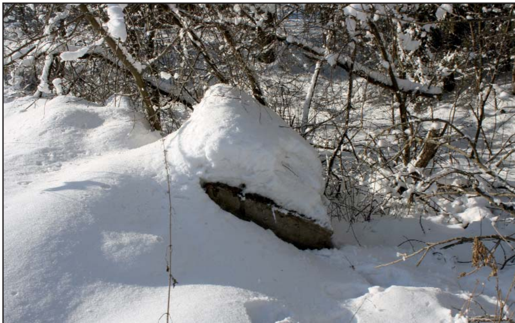
Остатки разрушенного пограничного столба. 22 февраля 2009 г.

Но нам верится, что с вашей помощью, дорогие читатели, мы найдем подобные пограничные столбы, а главное, сделаем все, чтобы их сохранить.