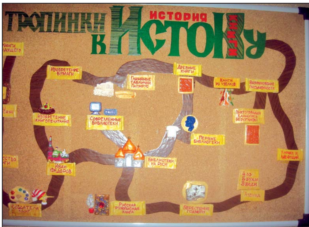
Музей школы. Панно «Тропинки к Истоку».